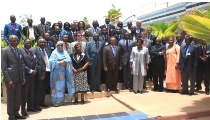
Participants au Comité régional de pilotage

Un atelier technique interne organisé sur trois jours par l'ONUDI a permis aux CTN d'améliorer leur connaissance du programme et d'en faciliter la mise en œuvre dans leurs pays respectifs.