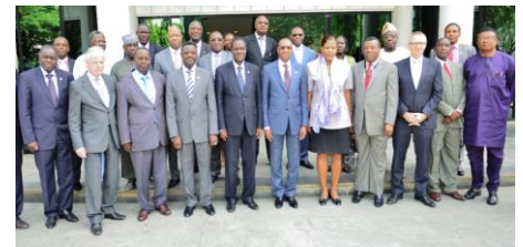
Personnalités présentes au lancement: Présidents des Commissions CEDEAO et UEMOA, Représentant de l'ONUDI au Nigéria, Responsable de la Coopération à l'UE, Directeur de la GIZ pour l'Afrique

Le PSQAO s'inscrit dans le cadre plus large d'un programme financé par l'UE concernant le soutien à la compétitivité et au secteur privé dans la région.